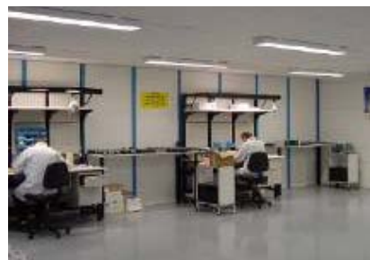
La structure de Beauvais dispose entre autres d'une salle ESD pour intégrations sensibles.

APW, l'un des fournisseurs leaders de solutions globales en terme de fabrication et d'intégration électronique, répond à toutes les applications technologiques de ces secteurs d'activités. Flexible et évolutive, la filiale française APW Enclosures SAS s'est spécialisée dans la distribution de produits standard, mais également dans la réalisation de pièces spéciales en tôlerie fine et la fourniture de solutions d'intégration clé en main.